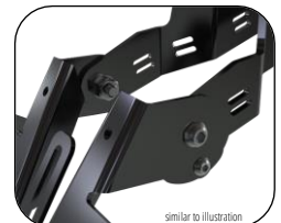
similar to illustration