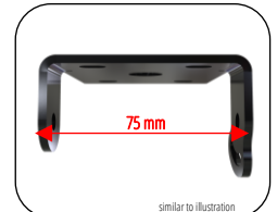
similar to illustration